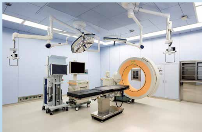
O-arm(術中断層撮影装置)