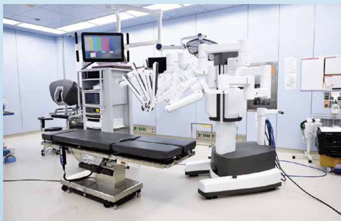
ダヴィンチ(手術支援ロボット)