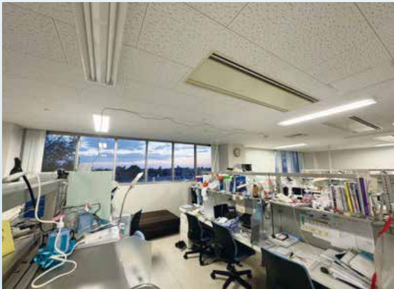
余裕のある個々の机