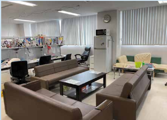
共有スペースもゆったり