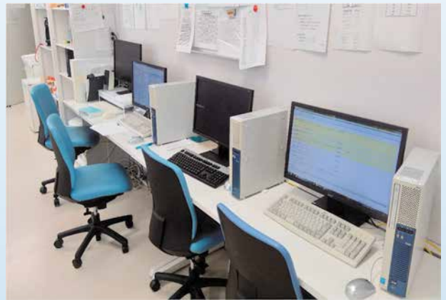
研修医室の電子カルテ端末